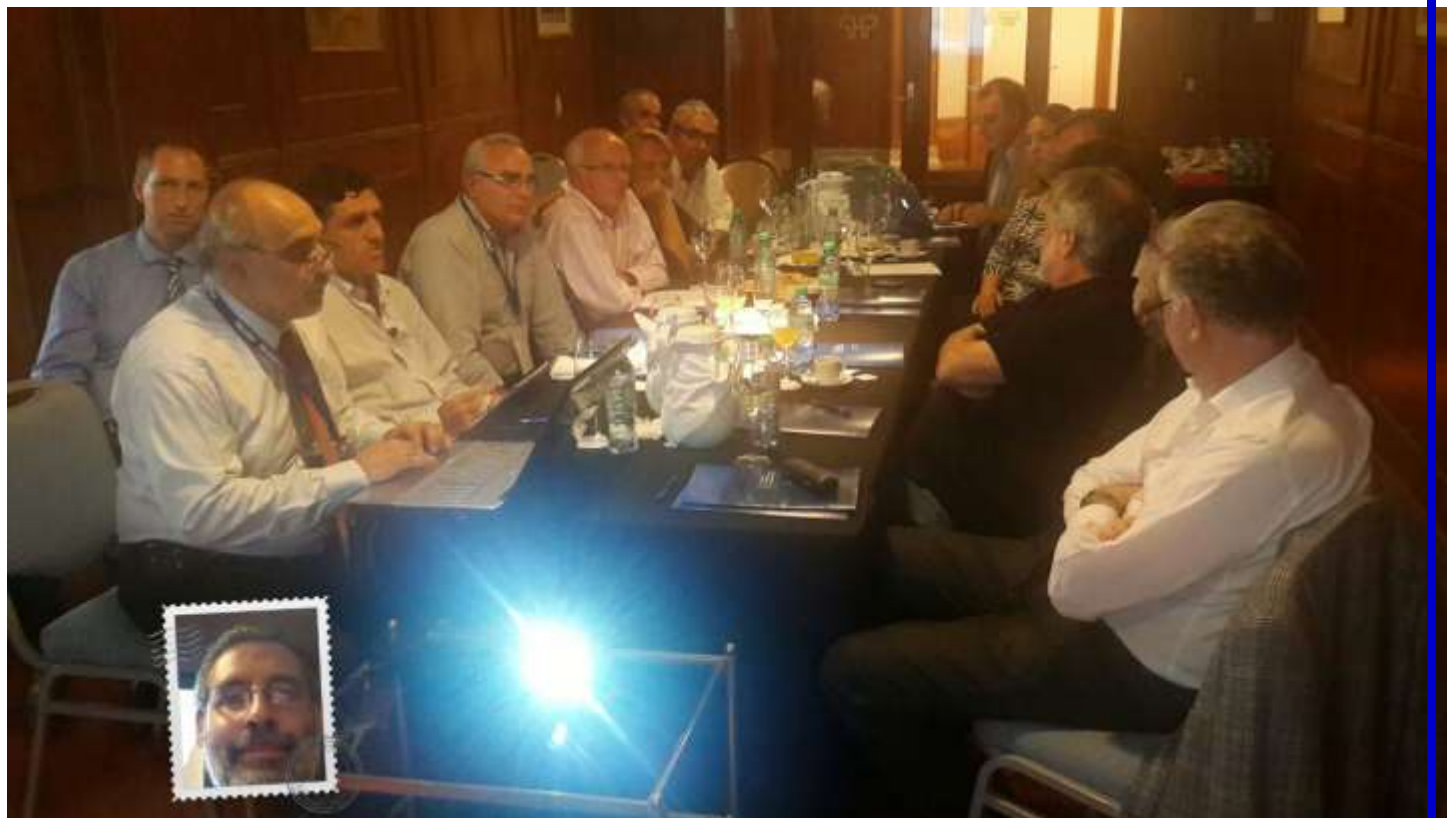
FOTO de la REUNION